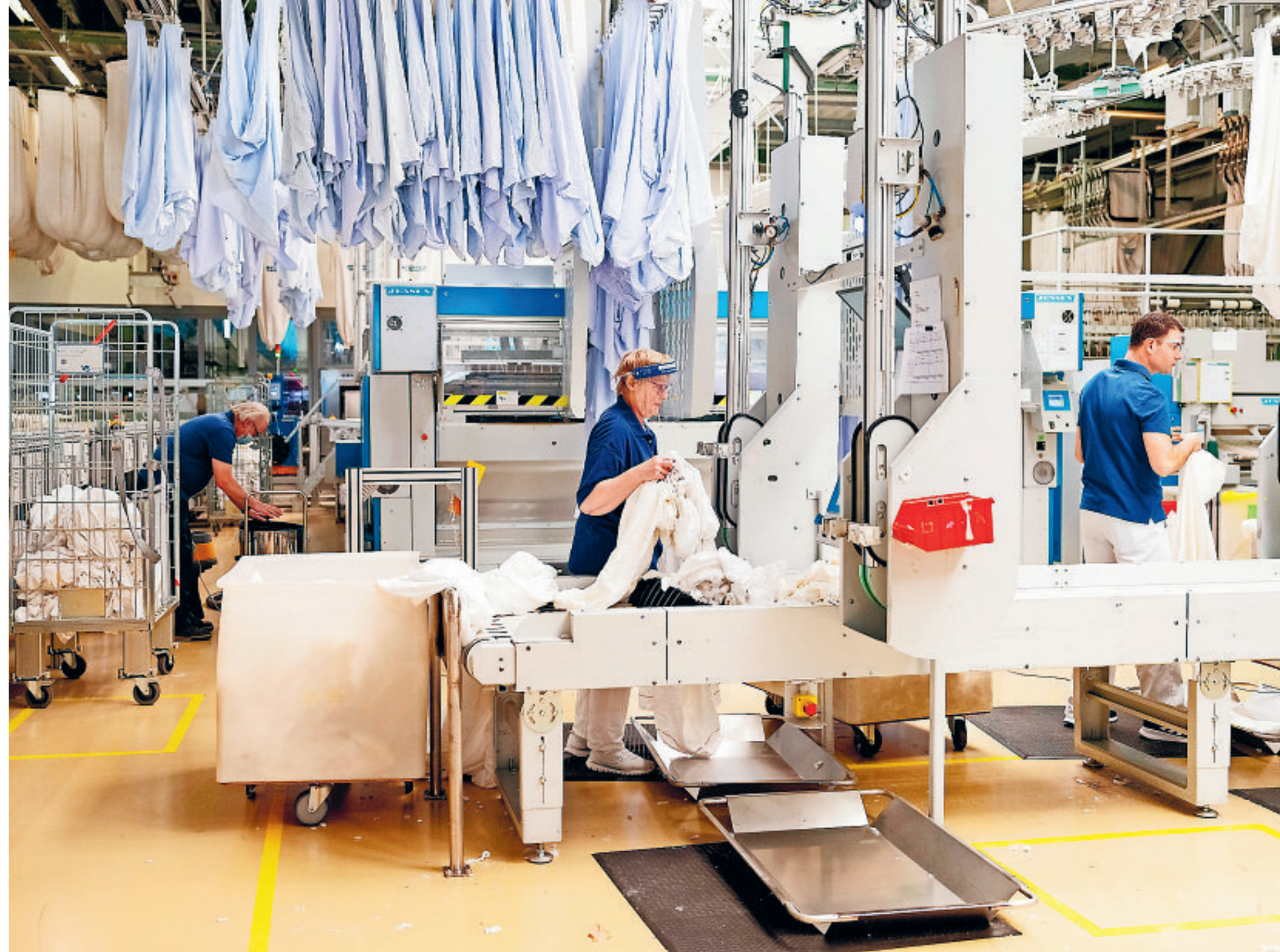
Bij Nedlin, een industriële wasserij in Elsloo, is concurrentie de motor achter de innovaties, maar de krapte op de arbeidsmarkt speelt ook een rol.